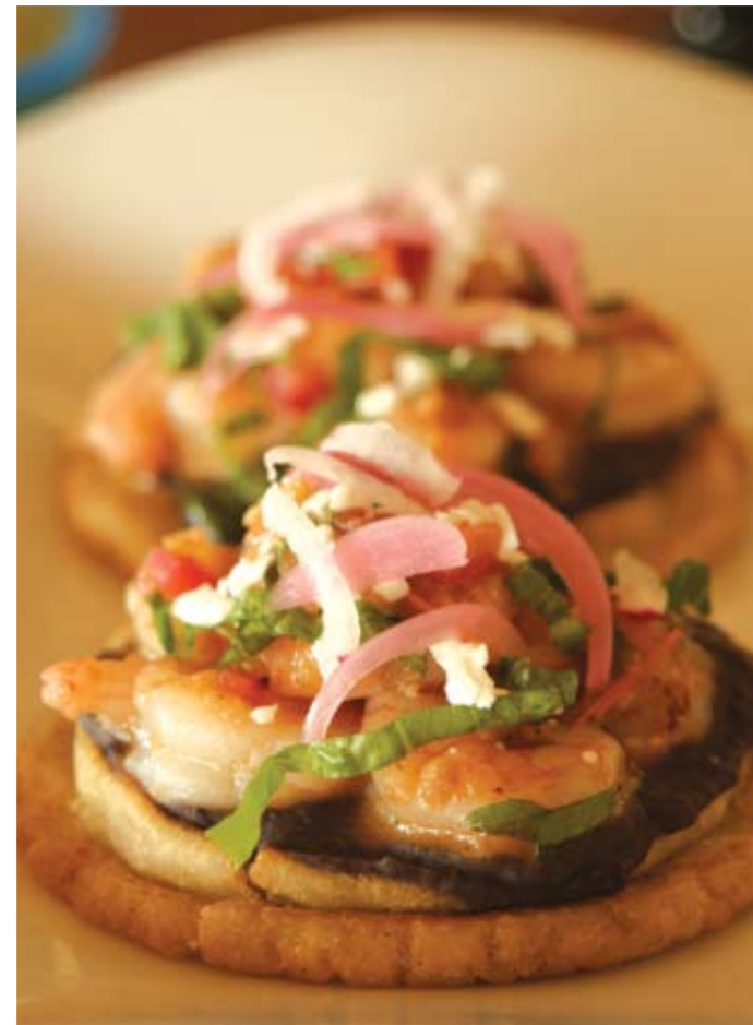
Imperio de los sentidos De izquierda a derecha: música y tequila a ras de playa; sopes de camarón del restaurante Ketsi del hotel Four Seasons Punta Mita; terraza y vista de la One Bedroom Ocean Front Suite.