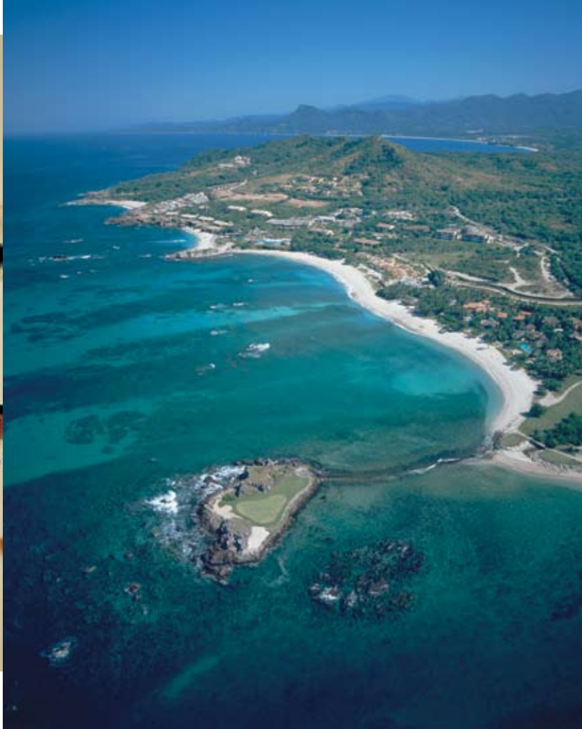
Naturaleza y cultura De izquierda a derecha: máscaras de la tienda para niños, en el hotel Four Seasons Punta Mita; costa oeste de la península de Punta Mita, límite norte de Bahía de Banderas.