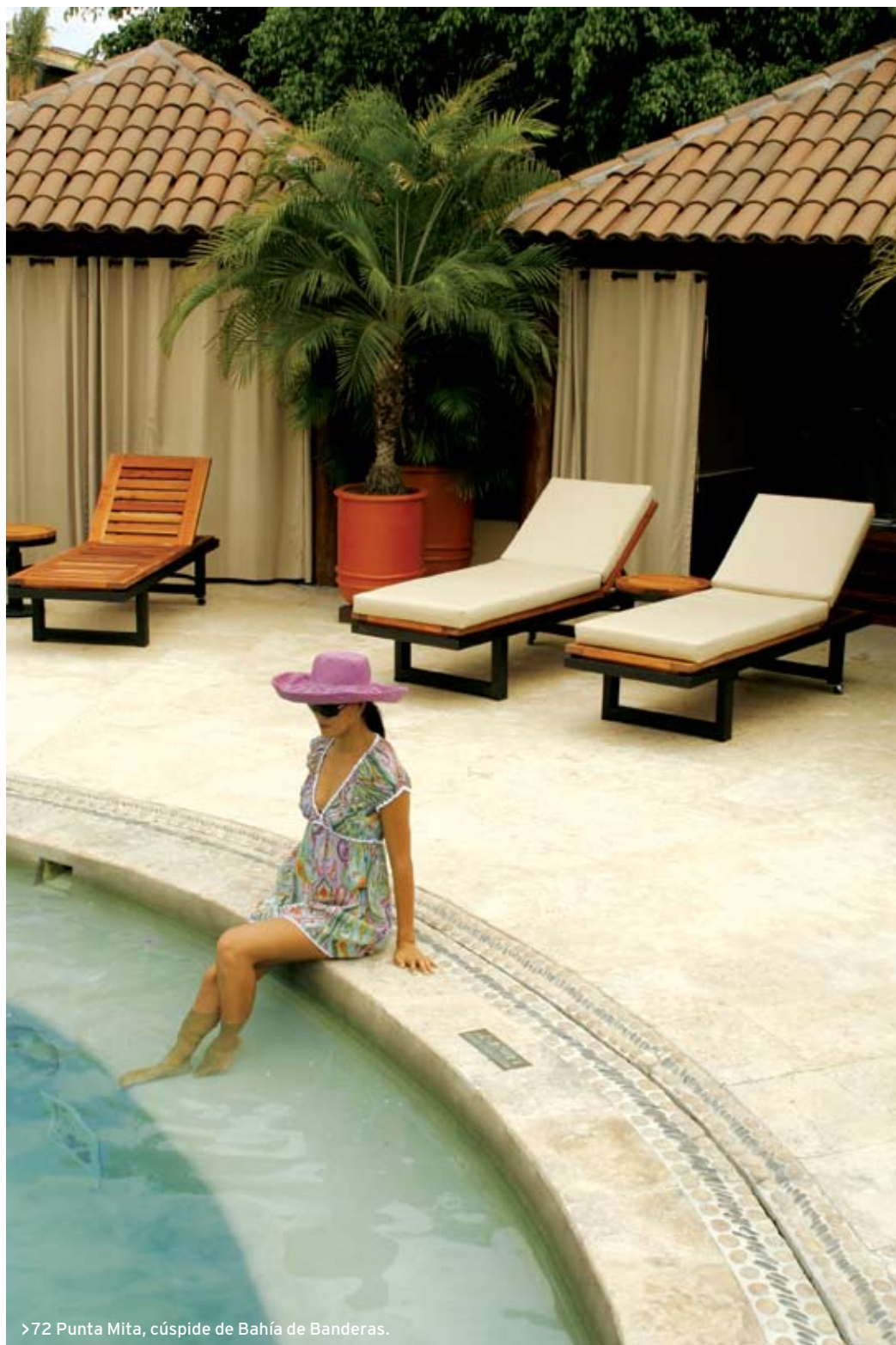
>72 Punta Mita, cúspide de Bahía de Banderas.

En los remotos rincones del sur de Italia, JOHN SEABROOK descubre lugares que resguardan los mejores y más innovadores vinos y platillos del país.